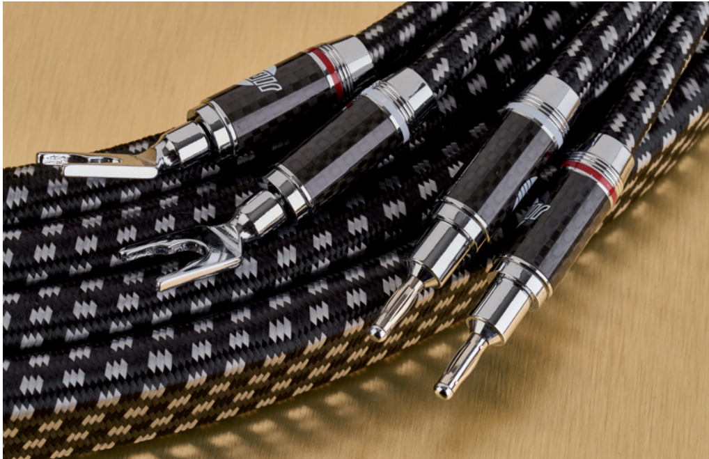
Zum Lieferumfang des Silver Actinium gehören verchromte Feder-Bananas und Gabelschuhe

Das gleiche Material isoliert auch die ebenfalls mit einer Karbonfaser-Hülse umgebenen BFA-Hohl-Bananas. Im Inneren wird das verlötete Kabel auch hier durch den schwarzen Kunststoff hermetisch vor Sauerstoff geschützt, um Oxydation zu verhindern.