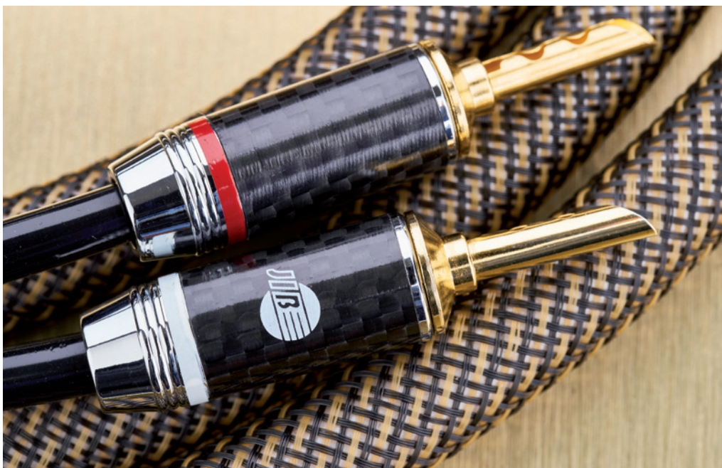
Das Argon wird mit vergoldeten Hohl-Bananas geliefert

der beiden Leiter mit je 2,0702 Quadratmillimeter Querschnitt erfolgt durch weiße und rote LD-Polyethylen-Umhüllungen. Sie sollen für eine langlebige und effektive Abschirmung gegen Magnetfelder sorgen. Mit zwei Baumwoll-Elementen werden beide Leiter voneinander distanziert, so dass die umschließende, runde Papier-Isolierung aufgefüllt ist. Zwei Schichten aus perlweißem PVC mit innen 11 und außen 12,8 Millimeter Stärke bilden die Ummantelung. Das schwarz-braune Nylon-Gewebe bildet den äußeren Abschluss und dient auch der Kosmetik, die bei allen Kabeln von JIB Boaacoustic nicht zu kurz kommt. Schönheit steht schließlich nicht im Widerspruch zu Technologie und gutem Klang. An den beiden Enden des Argon, wo sich das Kabel in die Plus- und Minus-Verbindung aufteilt, umhüllt und sichert poliertes Metall mit einer Karbonfaser-Hülse diese empfindliche Stelle. Innerhalb dieser Weiche dient eine Isolierung aus gespritztem Kunststoff dem Korrosionsschutz.