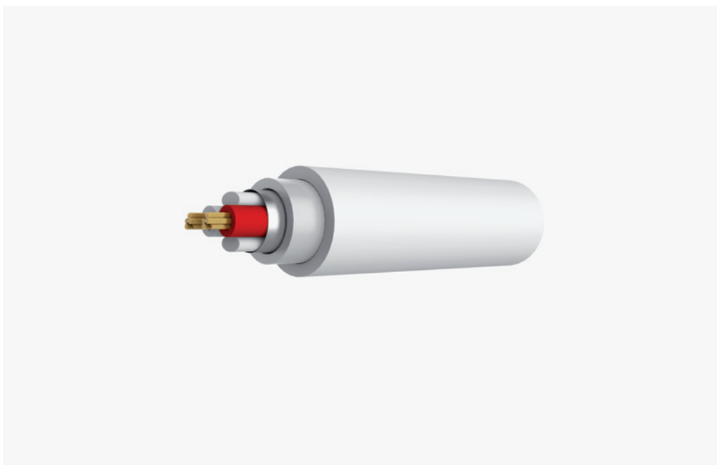
Der schematische Aufbau des Argon

Sollten Sie meinen Testbericht über die beeindruckend klingenden, kleinen Lautsprecher Ligna von Franco Serblin gelesen haben sollten, haben Sie bereits einiges über beide Boaacoustic LS-Kabel erfahren. Dir haben in unterschiedlichen Konfigurationen beide ihre Vorteile beweisen können. Zwar zeigte sich unter dem Strich das Silver Actinium als Favorit, das Argon hatte aber durchaus auch mal die Nase vorn. Für mich war dies ein sehr spannender Einstieg in den Vergleich. Denn ich spreche mich nicht davon frei, dem teureren Kabel von vornherein eine höhere Erwartung entgegenzubringen. Dies, obwohl die lange Erfahrung lehrt, dass Lautsprecherkabel sehr deutlich das Klangbild prägen können. Denn sie nehmen nicht unmaßgeblich teil an der elektrischen Wechselbeziehung zwischen Verstärker und Lautsprecher.