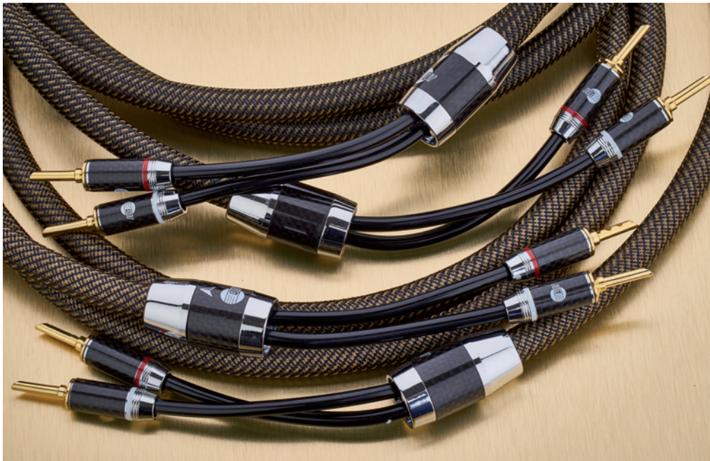
Das Argon, aber auch das Silver Actinium, bieten einen hohen Gegenwert für's Geld

Vorteile für sich verbuchen: Es spielte kraftvoller und vermittelte mehr Energie. Die in anderen Konstellationen wahrgenommenen Vorteile in der Hochtonwiedergabe fielen hier nur minimal ins Gewicht. Obwohl die Lautsprecher-Endstufen-Kombination für etwa dreißigtausend Euro die Investition in das teurere Kabel wohl hätte angemessen sein lassen, ist sie unter dem musikalischen Aspekt nicht zwingend notwendig. Die beiden Kabel sind sich im Grunde klanglich sehr ähnlich, wenn es um musikalisch relevante Charakterzüge geht. Beide stehen für Rhythmus und musikalischen Fluss. Beide gefallen wegen ihres homogenen Klanges. Dabei kommen kraftvolle, farbige Impulse dynamisch nie zu kurz. So macht Hören Spaß, denn aufdringlich oder gar überbetonend geben sich beide Boaacoustics niemals. Einen eindeutigen Sieger konnte ich nur bei Franco Serblins vorzüglichen Ligneas erkennen, nämlich das Silver Actinium. Aber auch dort war beim Rock-Konzert Free Live! das Argon im Bass im positiven Sinne anmachender. Je nach verwendetem Verstärker oder Lautsprecher dürfte es sich lohnen, beide Kabel in der heimischen Anlage zu vergleichen. So lässt sich sicher ermitteln, ob die überlegene Hochton-Auflösung und energiereichere Darbietung doch für das Silver Actinium sprechen.