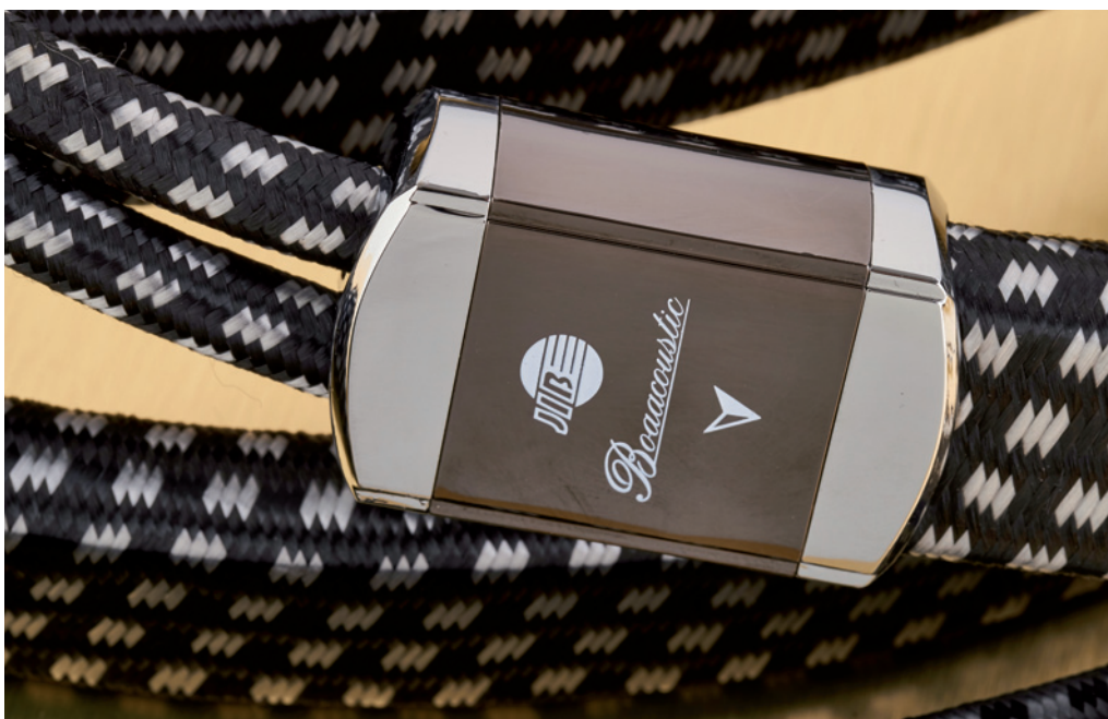
Die Weiche des Silver Actinium, wo das Kabel in die Plus- und Minus-Leitung aufgeteilt ist, besitzt innen aufwendige Isolierungen

Nun wird zuerst das Argon zwischen Spectral-Endstufe und den Quadral-Platinum M50 Lautsprechern angeschlossen. Es hinterlässt einen ausgesprochen stimmigen Eindruck, präsentiert sich als klangfarbenstark und ausgewogen. Das musikalische Bild gefällt, weil keinerlei Überzeichnungen stören. Das Argon harmonisiert mit dem exzellenten Hochtton-Ringradiator der Platinum und dem distinguierten Charakter der Spectral. Sowohl bei Big-Band-Jazz vom Plattenspieler, wie dem kürzlich überarbeiteten MPS-Album Clark After Dark von Clark Terry, als auch bei der bekannten „Scheherazade“ mit Fritz Rainer stellt sich sofort Hörvergnügen ein. Besonders bei diesem orchestralen Werk imponieren die Energie des Orchesters ebenso wie die Solo-Geige, weil die gestrichenen Saiten sehr präsent und mit Wärme wiedergegeben werden. Mit diesem Klangbild komme ich