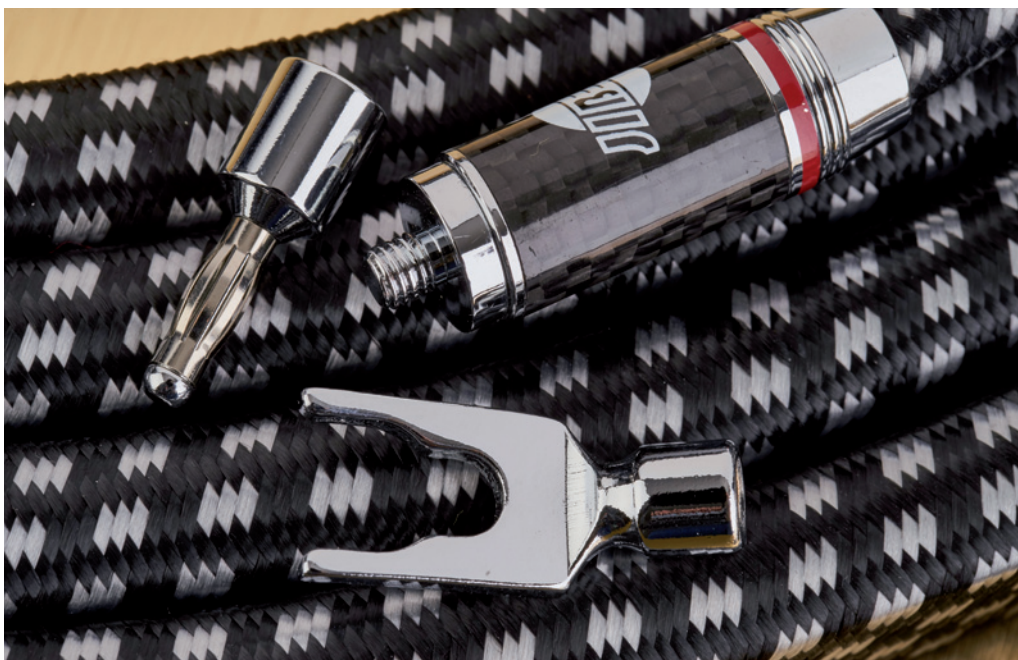
Beim Silver Actinium lassen sich die gewünschten Anschlüsse einfach aufschrauben

Wesentlich mehr Gewicht als das Argon bringt das JIB Boaacoustic Silver Actinium auf die Waage. Es ist nicht rund, sondern rechteckig. Die „flache“ Seite ist mit dreizehn Millimetern beinahe so stark wie der Durchmesser des Argon. Die breite Seite habe ich mit 27,5 Millimetern gemessen. Trotz seiner stattlichen Masse ist das Kabel recht beweglich. Wie der Name erwarten lässt, ist das Silver Actinium um symmetrisch angeordnete Leiter aus versilbertem Kupfer S-OCC 6N aufgebaut. Das monokristalline Rohmaterial kommt aus Japan. Dies