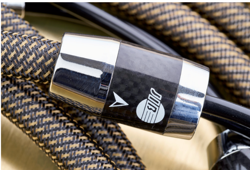
Das Argon ist ebenso aufwendig gefertigt