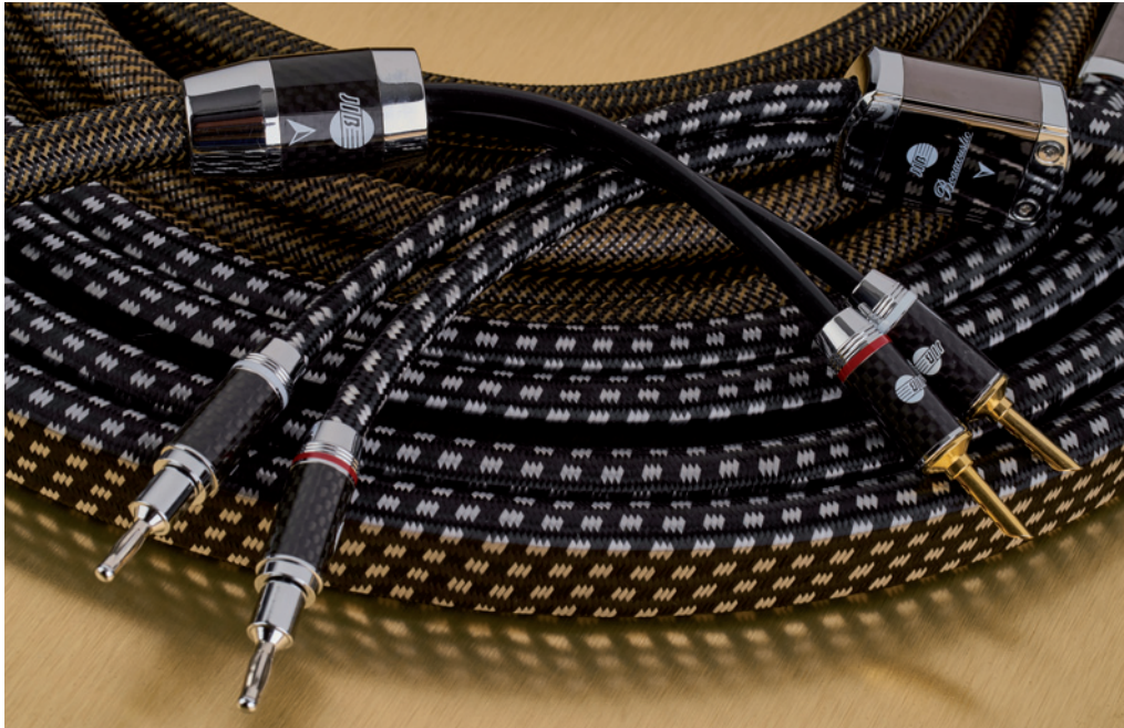
Unterschiede gibt es beim technischen Aufbau der beiden Kabel, aber auch bei den Anschluss-Steckern

der beiden Leiter mit je 2,0702 Quadratmillimeter Querschnitt erfolgt durch weiße und rote LD-Polyethylen-Umhüllungen. Sie sollen für eine langlebige und effektive Abschirmung gegen Magnetfelder sorgen. Mit zwei Baumwoll-Elementen werden beide Leiter voneinander distanziert, so dass die umschließende, runde Papier-Isolierung aufgefüllt ist. Zwei Schichten aus perlweißem PVC mit innen 11 und außen 12,8 Millimeter Stärke bilden die Ummantelung. Das schwarz-braune Nylon-Gewebe bildet den äußeren Abschluss und dient auch der Kosmetik, die bei allen Kabeln von JIB Boaacoustic nicht zu kurz kommt. Schönheit steht schließlich nicht im Widerspruch zu Technologie und gutem Klang. An den beiden Enden des Argon, wo sich das Kabel in die Plus- und Minus-Verbindung aufteilt, umhüllt und sichert poliertes Metall mit einer Karbonfaser-Hülse diese empfindliche Stelle. Innerhalb dieser Weiche dient eine Isolierung aus gespritztem Kunststoff dem Korrosionsschutz.